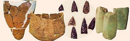
岩見沢の遺跡で発掘された土器や石器が大集合!